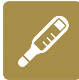
従業員の検温実施