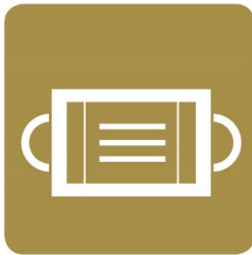
従業員のマスク着用